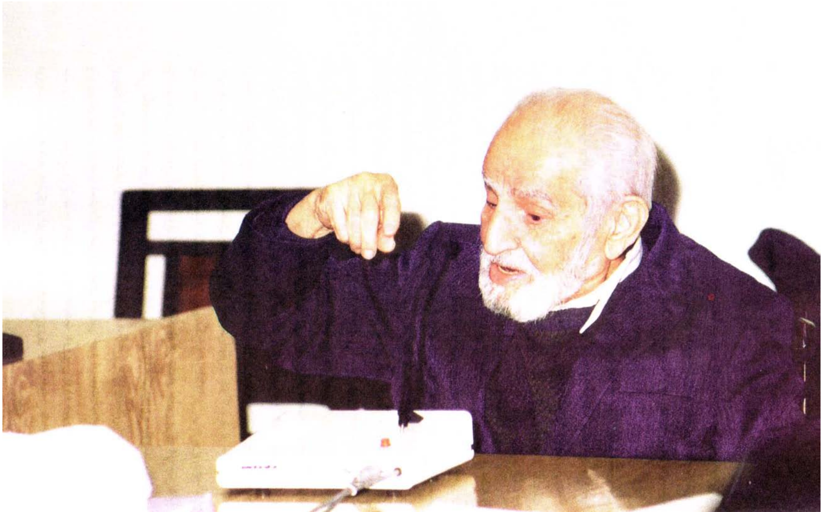
شادروان استاد احمد آرام در حال مصاحبه در محل فرهنگستان زبان و ادب فارسی (۱۳۷۶)